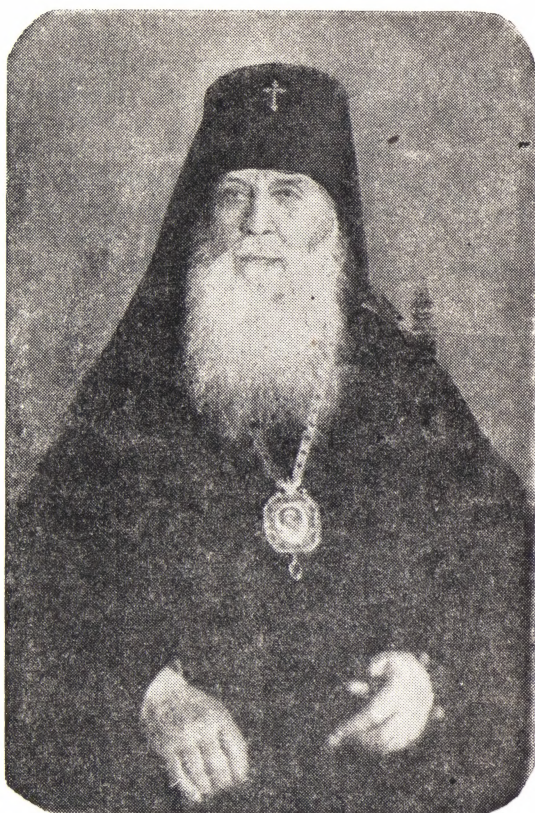
АРХИЕПИСКОП ДМИТРОВСКИЙ ВИТАЛИЙ